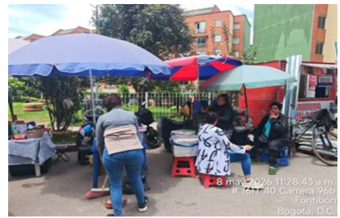
8 may 2026 11:28:43 a.m. # 16H-40 Carrera 96b Fontibón Bogotá, D.C.