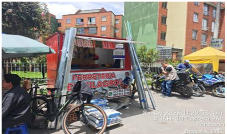
8 may 2026 11:29:03 a.m. # 16H-40 Carrera 96b Fontibón Bogotá, D.C.