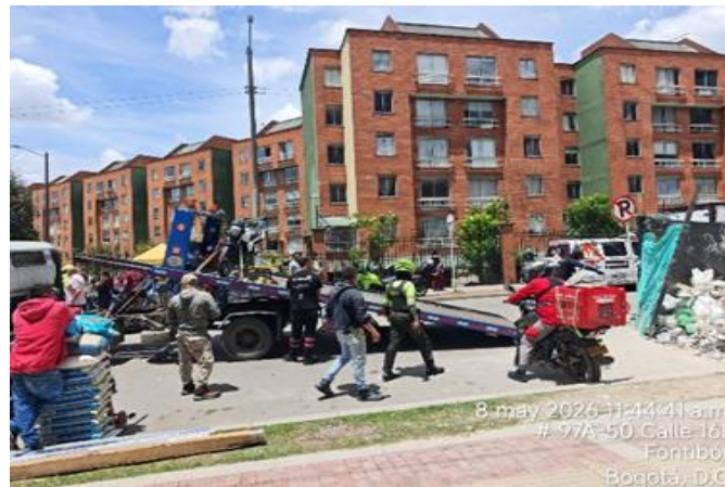
8 may 2026 11:44:41 a.m. # 97A-50 Calle 101 Fontibón Bogotá, D.C.