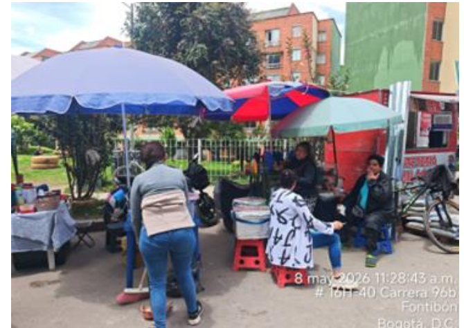
8 may 2026 11:28:43 a.m. # 16H-40 Carrera 96b Fontibón Bogotá, D.C.