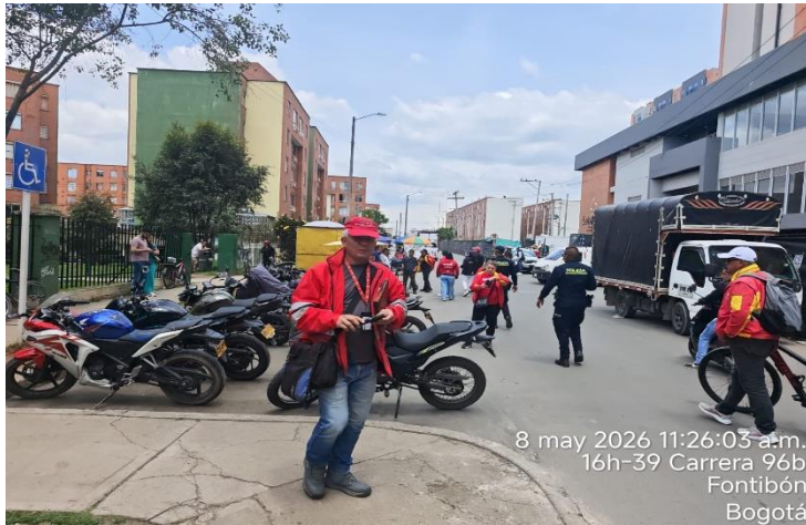
8 may 2026 11:26:03 a.m. 16h-39 Carrera 96b Fontibón Bogotá