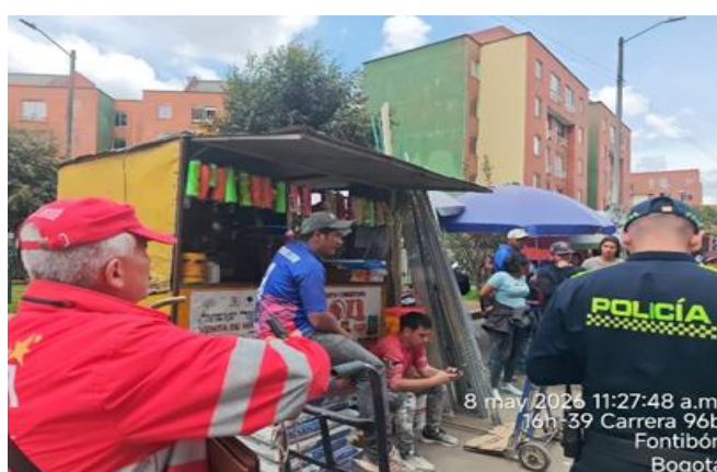
8 may 2026 11:27:48 a.m. 16h-39 Carrera 96b Fontibón Bogotá