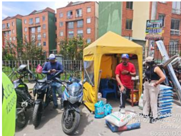
8 may 2026 11:29:24 a.m. 16h-40 Carrera 96b Fontibón Bogotá, D.C.