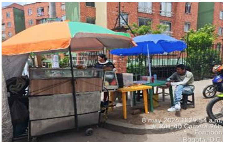
8 may 2026 11:29:54 a.m. # 16H-40 Carrera 96b Fontibón Bogotá, D.C.