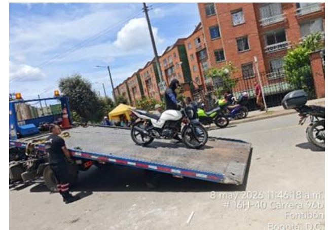
8 may 2026 11:46:18 a.m. # 16H-40 Carrera 96b Fontibón Bogotá, D.C.